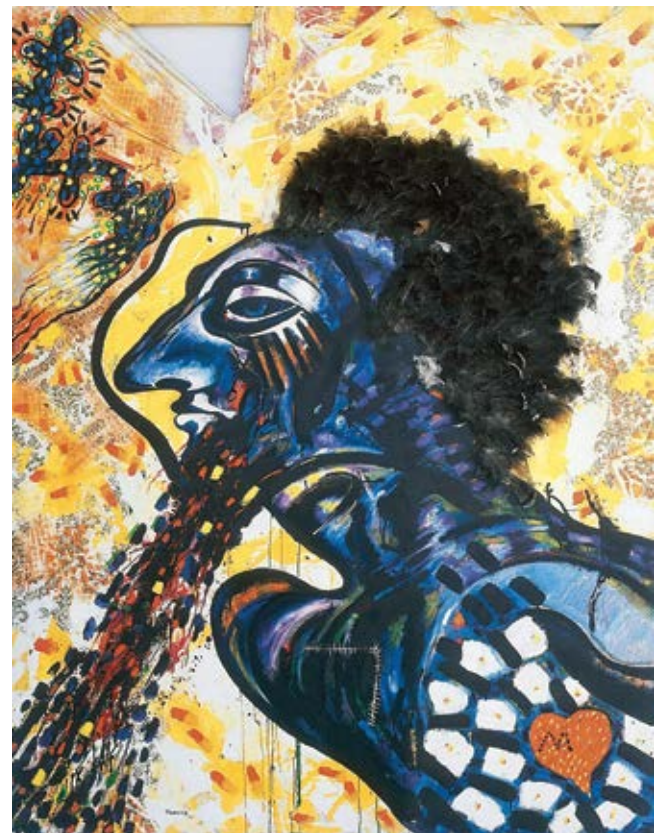
Κεφάλι / Head , 1985 Λάδι / Oil, 195x149x9 εκ. / cm.