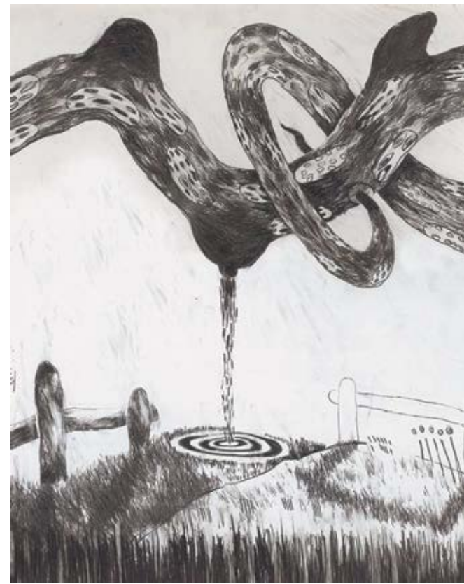
Χωρίς τίτλο / Untitled , 2011 Μολύβι / Pencil, 70x100 εκ. / cm.