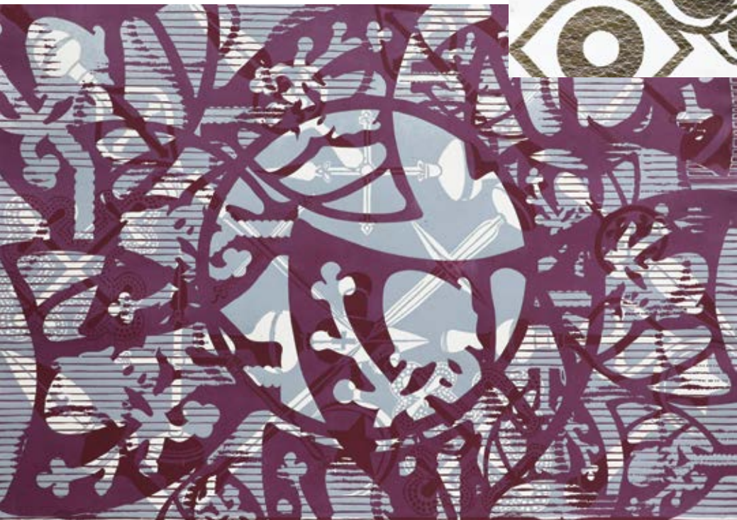
Quarantine III , 2022 Monotype, engraved in relief in linoleum 100x70 cm.