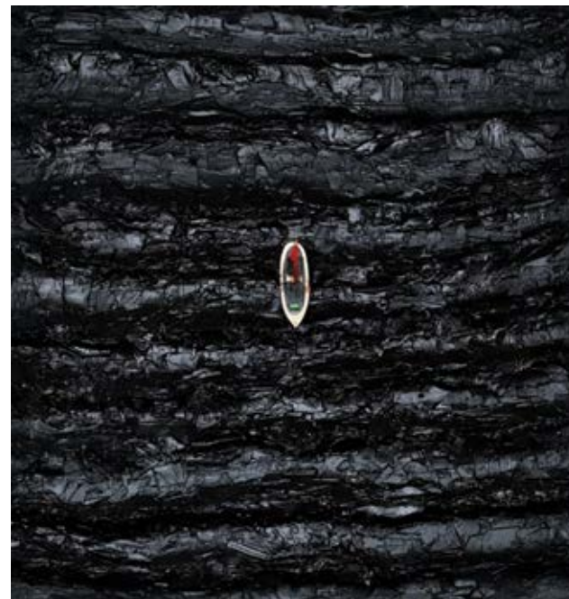
Μεσόγειος / Mediterranean , 2018 Πίσσα σε ξύλο / Tar in wood, 100x100 εκ. / cm.