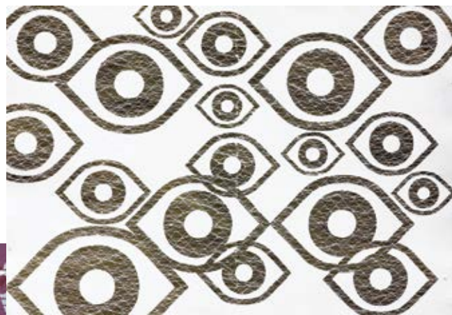
Karantina III , 2022 Μονότυπο, ανάγλυφη χάραξη σε λινόλαιο 100x70 εκ.

A visual creator with a rich artistic output, who merges Design with Drawing and Printmaking in an exploratory and morphoplastic way. What has preoccupied him is the relationship between “man and space”. He studied at the School of Graphic Arts of the Doxiadis Athens Technological Organization (ATO), from 1972 to 1975. Afterwards, from 1975 to 1980, in the Printmaking workshop of Costas Grammatopoulos at the Athens School of Fine Arts (ASKT) he combined his previous knowledge from the Doxiadis School with the techniques of Printmaking. He taught Drawing from 1986 to 1997 and Printmaking from 1997 to 2022 at the School of Visual and Applied Arts of the Faculty of Fine Arts A.U.Th., passing from all the teaching levels (Associate, Assistant and Professor). From 2023 he is Emeritus Professor of A.U.Th. He is a member of the Association of Fine Artists of Northern Greece (SKETVE) and the Chamber of Fine Arts of Greece. He organized 25 individual exhibitions with his first in 1984 in Athens with paintings-drawings at the Athens Art Gallery and recently in 2023 in Thessaloniki with the title “I was there too”. Finally, he has represented Greece in many international exhibitions. His works can be found in private collections, public galleries, cultural institutions and museums both in Greece and abroad. He now lives and works in Thessaloniki.